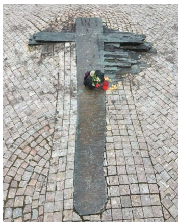
Památník Jana Palacha a Jana Zajíce v dlažbě před Národním muzeem