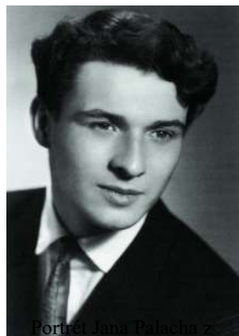
Portrait of Jan Palach at his maturitního tabla (1966)

VŠE (Vysokou školu ekonomickou) a začal studovat zemědělskou ekonomii. V roce 1968 pokus o studium na FF UK zopakoval. Tentokrát úspěšně – byl přijat do druhého ročníku oboru historie – politická ekonomie. Tím se mu splnil jeho odvěký sen. Už od malička snil o tom, že se jednou stane historikem.