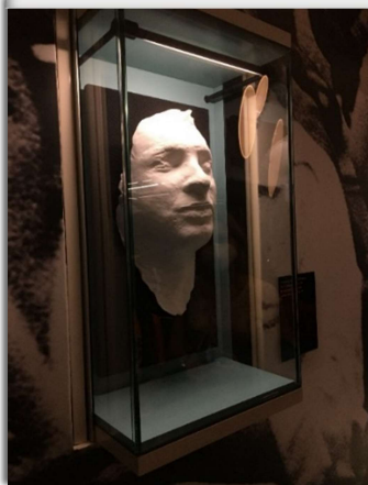
Sádrová posmrtná maska, opět od Olbrama Zoubka; k vidění v Národním muzeu na výstavě Dějiny 20. století