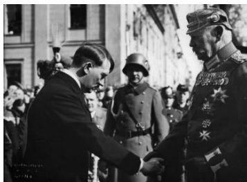
Jmenování Hitlera kancléřem

Abychom byli schopní pochopit, proč druhá světová válka vůbec začala, musíme si nejprve rozebrat situaci, ve které se Německo nacházelo po konci té první. Poté, co 11. listopadu 1918 skončila tenkrát dosud nejničivější válka, bylo Německo pokládáno za jejího hlavního viníka. Na základě