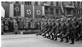
Německá vojska okupující ČSR

O den později, 16. března, byl zřízen Protektorát Čechy a Morava. Všechny české úřady byly přeměněny na protektorátní, gestapo začalo zatýkat nepohodlné osoby a říšským protektorem se stal Konstantin von Neurath, který ve funkci setrval až do roku 1941 (tehdy ho nahradil Heydrich). Český národ čekalo šest let nejistoty pod tvrdým útlakem nacistické říše, který byl ukončen až pražským povstáním v květnu 1945.