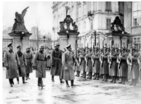
Adolf Hitler na Pražském hradě