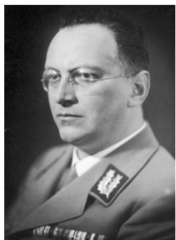
Předseda SdP Konrad Henlein

Německá menšina obývající pohraničí, která čítala víc než 3 miliony obyvatel, se v Československu cítila utlačována. Sice v průběhu 20. a 30. let procházela značným kulturním a jazykovým rozvojem –