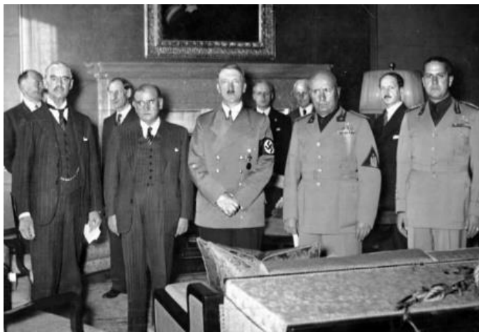
Představitelé Velké Británie, Francie, Německa a Itálie po podpisu Mnichovské dohody; zleva: N. Chamberlain, E. Daladier, A. Hitler, B. Mussolini

Dne 15. září se konečně podařilo dohodnout schůzku Chamberleina s Hitlerem. O čtyři dny později se Chamberlain sešel s francouzským premiérem Daladierem v Londýně a společně vyzvali Československo k odstoupení pohraničí ve prospěch Německa.